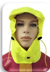
ILLUSTRATION ET MODE D'EMPLOI

Capuche « MAGIC » (brevetée) qui suit les mouvements de la tête