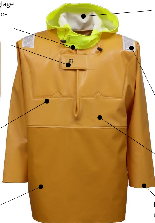
ILLUSTRATION ET MODE D'EMPLOI

La capuche « Magic » suit les mouvements de la tête et permet le port de casque de protection