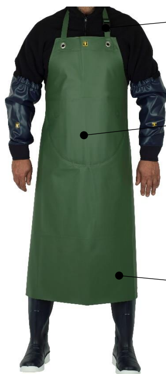
ILLUSTRATION ET MODE D'EMPLOI

S'accroche autour du cou par une lanière tissu, réglable par une boucle fermoir plastique