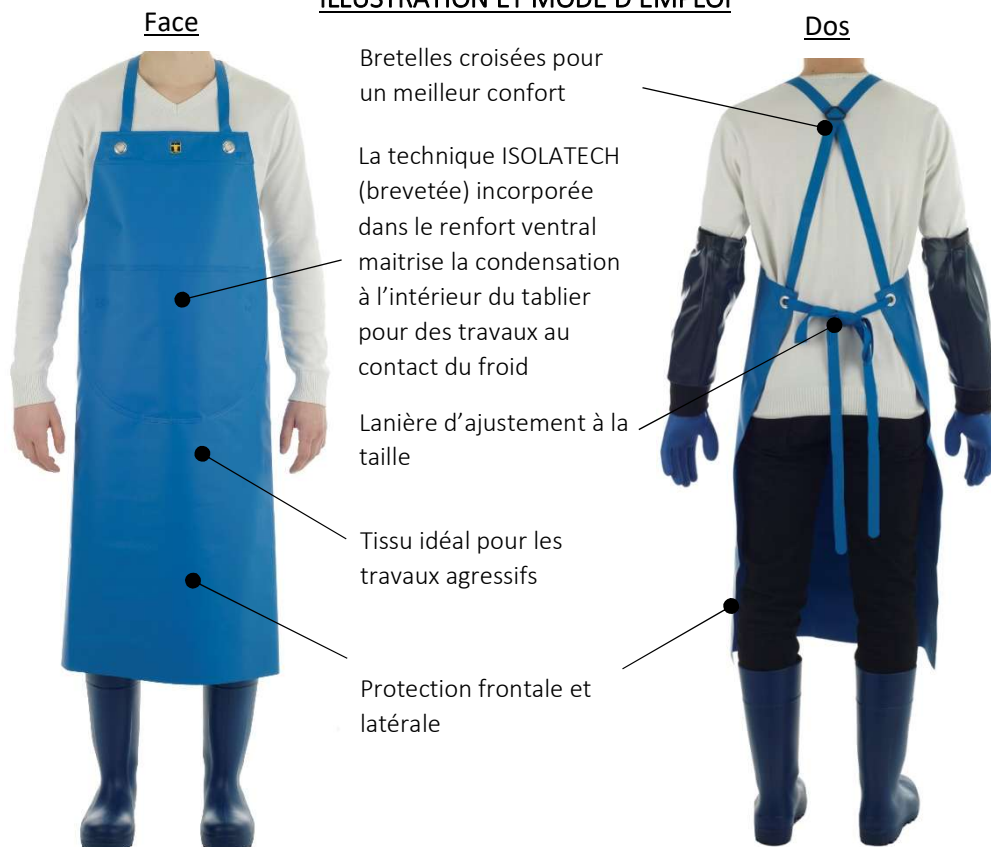
ILLUSTRATION ET MODE D'EMPLOI

EPI = Equipement de Protection Individuelle