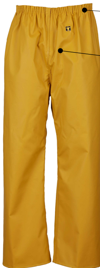
ILLUSTRATION ET MODE D'EMPLOI

- Eloigner de sources de chaleur intenses et flammes.