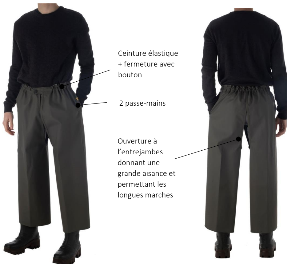
ILLUSTRATION ET MODE D'EMPLOI

Ceinture élastique + fermeture avec bouton