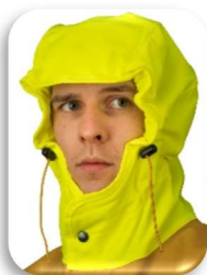
ILLUSTRATION ET MODE D'EMPLOI

Capuche « MAGIC » (brevetée) qui suit les mouvements de la tête