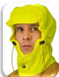
ILLUSTRATION ET MODE D'EMPLOI

Capuche « MAGIC » (brevetée) qui suit les mouvements de la tête